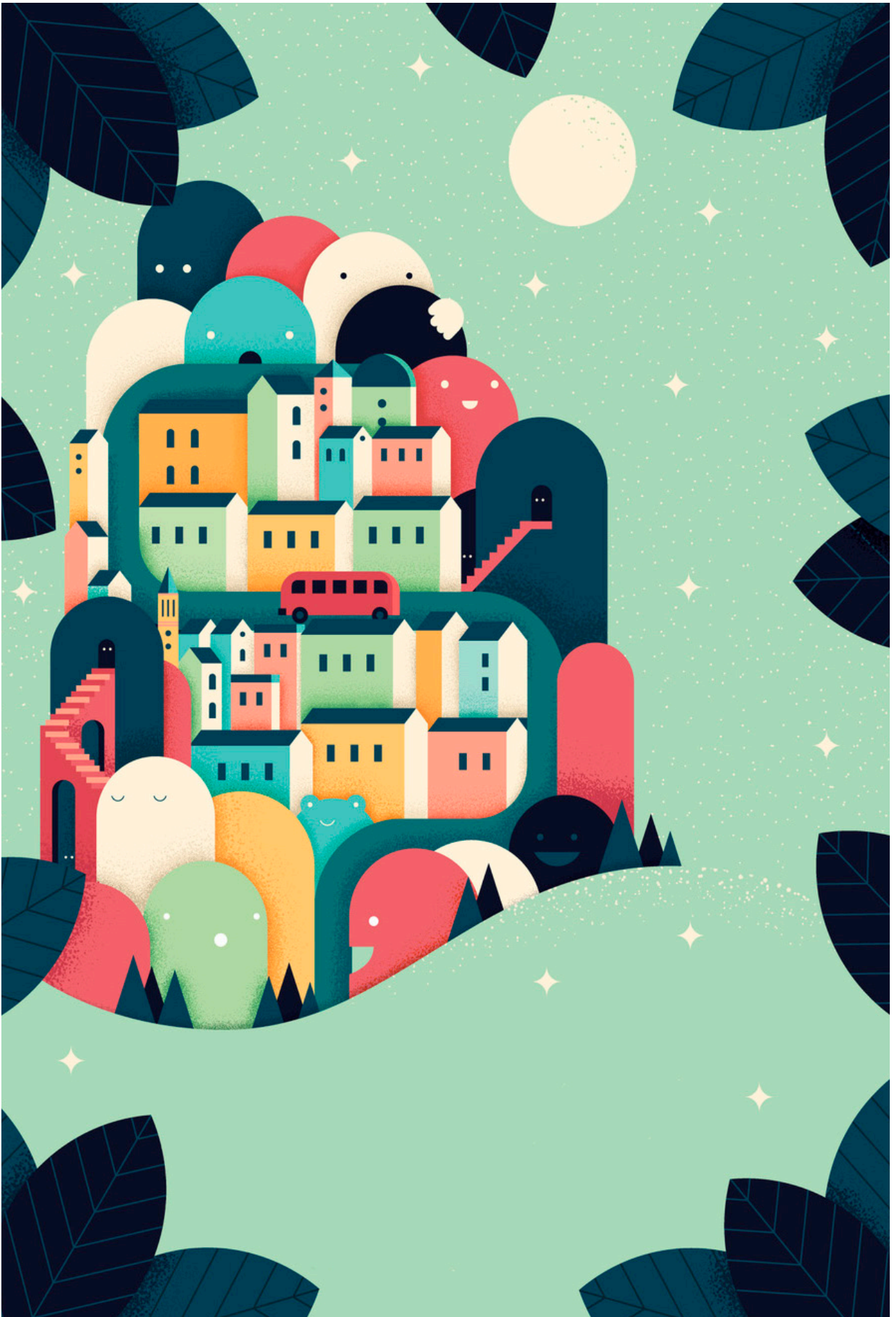
Affisch till Stjärnkalaset. Illustration: Valeria Hedman/Transferstudio.